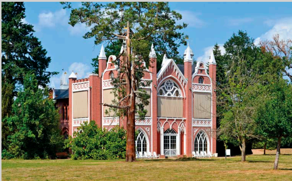
Obr 9: Gotický dům ve Wörlitz, mající podíl na vytváření povědomí o historizujících trendech v architektuře ve střední Evropě.