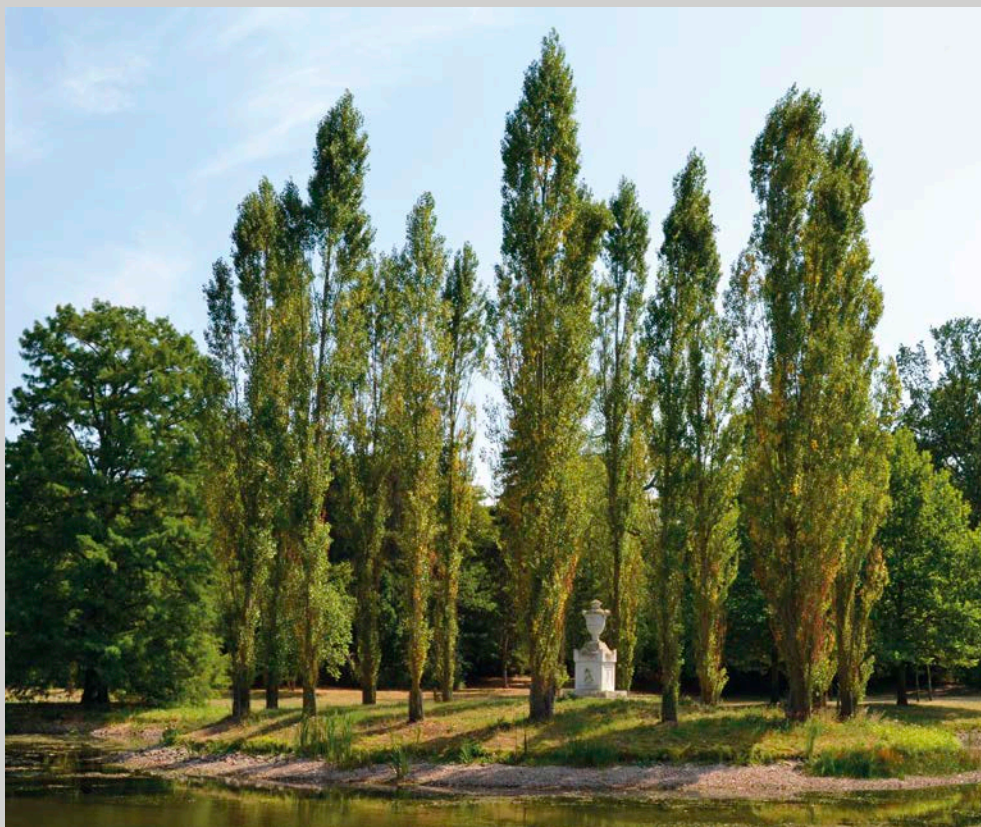
Obr 11: Tzv. Rousseauův ostrov ve Wörlitz.

Po nastínění role zahraničních cest, předlohové literatury přinášející seznámení s konkrétními architektonickými vzory, pracemi teoretiků zahradního umění a díly filozofů je zapotřebí alespoň v krátkosti zmínit dvě další záležitosti, které se svým významem (pokud jde o hmatatelné stopy kulturního transferu) liší od předchozích kategorií. Řeč je o krásné literatuře (třebaže ta se mnohdy prolíná s kategorií děl slavných filozofů) a malířství. Začněme první z nich. Dobová próza i poezie opěvující přírodní skvosty ovlivnily chápání přírody a vztah člověka k přírodě, čímž měly významný vliv i na vznik konceptu krajinářských parků. Například i na britských ostrovech nalezneme příklady parků ovlivněných konkrétními plody krásné literatury. 57