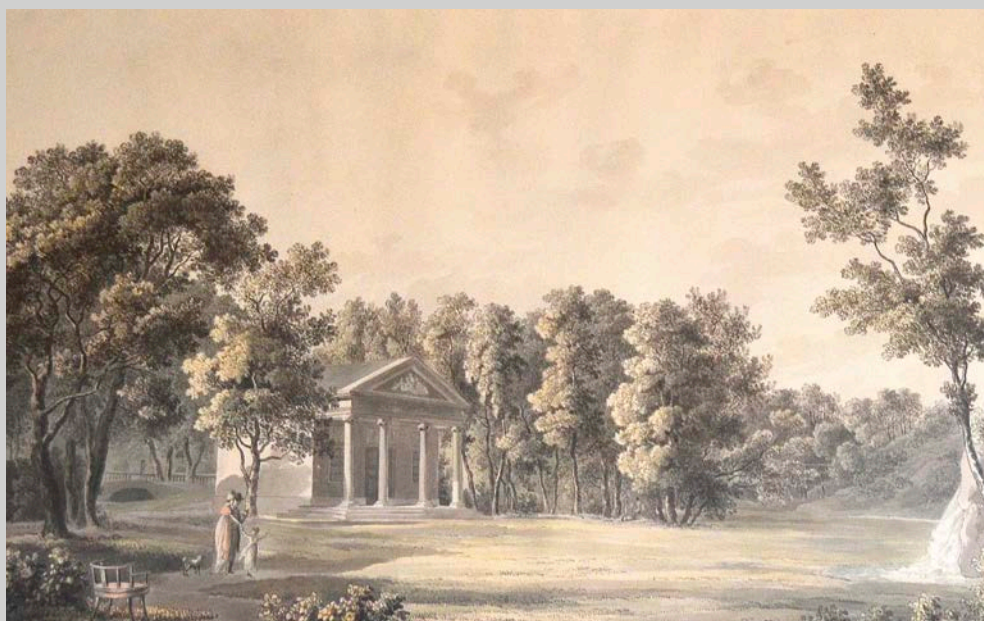
Obr 2: Krásný Dvůr s tzv. Panovým templom a umělým vodopádem.