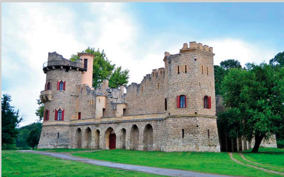
Obr 10: Janův hrad v Lednici, umělá zřícenina postavená z iniciativy Aloise I. Josefa z Liechtensteina a dokončená Janem I. Josefem z Liechtensteina, odrážející dobové trendy historismu v zahradní architektuře.