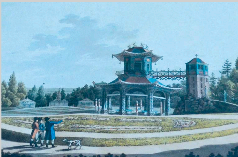
Obr 7: Čínský pavilon ve Vlašimi. Ze sbírek Národního památkového ústavu, územní památkové správy v Kroměříži.

století mnohdy jinou podobu než ty, které byly zakládány například ve Velké Británii. Ve Francii totiž často vznikalo něco, co je označováno jako „jardin anglo-chinois“, tedy zahrady, v nichž se snoubí vlivy převzaté z Anglie s inspiracemi z Dálného východu. Třebaže bychom podobné elementy našli i ve Velké Británii 40 a ve Svaté říši římské, 41 je právě pro plody francouzské krajiny tvorby 18. století existence nejrůznějších čínských kiosků a pagod ještě častější a typičtější. Některé francouzské projekty byly ve střední Evropě známy právě z předlohové literatury, a proto inspirovaly i vznik obdobných staveb v tamějších zahradách a parcích. Existuje důvod domnívat se, že je to případ i čínského pavilonu v parku ve Vlašimi, založeném rodem Auerspergů, který byl patrně ovlivněn obdobným pavilonem v parku Monceau v Paříži. 42 Jedním z nejdůležitějších děl, jež Středoevropanům zprostředkovalo znalost těchto projektů, byla práce Jar-