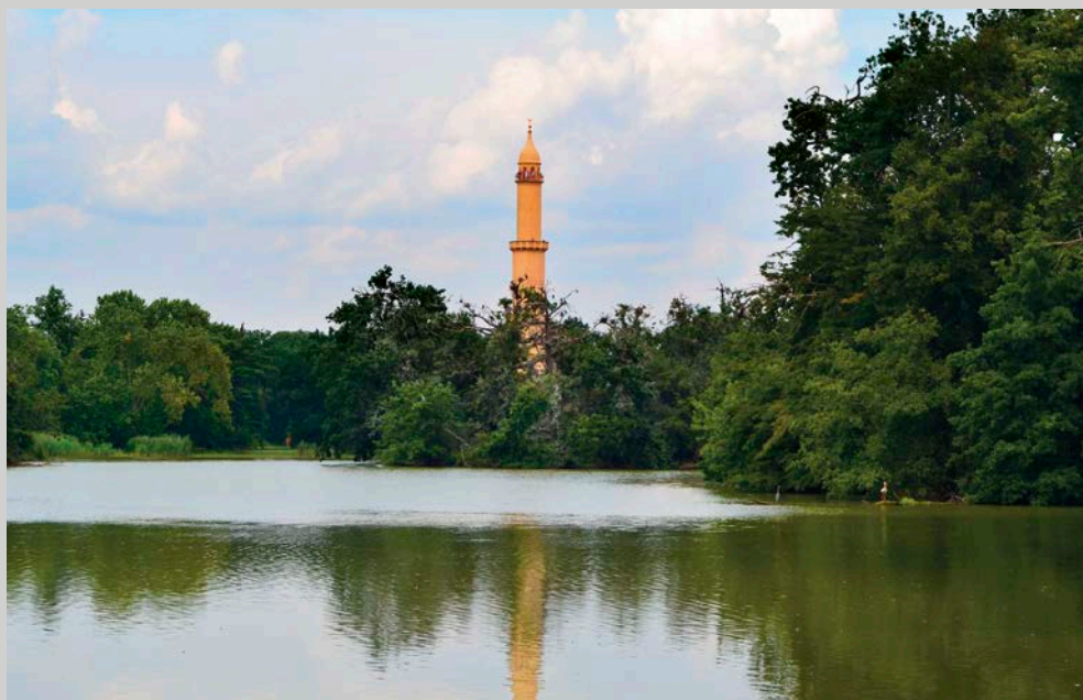
Obr 3: Park v Lednici s minaretem z doby knížete Aloise I. Josefa z Liechtensteina.

ovšem není možné datovat, hovoří mimo jiné dobový článek v osvícenském periodiku Patriotisches Tageblatt . 24 Přestože není jasné, jestli kníže spatřil přímo Wörlitz, je to velmi pravděpodobné, a to proto, že se v Anhaltsko-Desavsku soustředil na nejrůznější díla Leopolda III., částečně realizovaná i v jeho „zahradní říši“. Zejména mu šlo o Leopoldovy hospodářské reformy spojené s lesnictvím, které pak sám hodlal uvést v praxi i v Lednicko-valtickém areálu. S ním se totiž pojily i ekonomické záměry knížete týkající se zakládání lesních školek, které skutečně v areálu jeho zahrad vznikly a díky jejichž existenci pak bylo dřevo z Lednice odváženo a prodáváno do Evropy. 25 I tento příklad ukazuje, že v některých parcích vznikajících na přelomu 18. a 19. století nešlo jenom o záležitost přejímání kulturních vlivů, ale také o aplikaci určitých odborných poznatků.