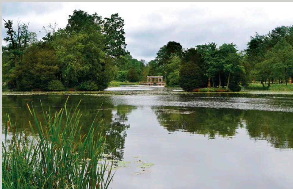
Obr. 1: Pohled do krajinářského parku ve Stowe.

ké kultury. 6 Obojí se pak snažili určitým způsobem „přénést“ do své vlasti, díky čemuž se v Anglii, jak vyplývá z předchozích odstavců, objevily první krajinářské parky vůbec. Mezi nejranější příklady patří Chiswick, situovaný dnes na předměstí Londýna a vytvořený ve spolupráci stavebníka Richarda Boyla, hraběte z Burlingtonu, a stavitele v podobě věhlasného zahradního architekta Williama Kenta. Není náhodou, že i vznik Chiswicku významným způsobem souvisí s Burlingtonovou výpravou do Itálie. 7 Stejně věhlasné, nebo možná ještě věhlasnější byly zahrady ve Stowe v hrabství Buckinghamshire, vytvářené pro Richarda Templa, prvního vikomta Cobhama, Kew Gardens v Londýně, upravované na popud britské královské rodiny, případně Stourhead, Studley Royal Park a Painshill. Tyto projekty prosluly i v pevninské Evropě, díky čemuž se koncept vytváření krajinářských parků šířil rovněž do ní, mimo jiné i v důsledku intenzivních kontaktů jejich obyvatel, zejména elit, s ostrovním prostředím. Britské trendy rezonovaly velmi silně ve Francii, kde byly krajinářské parky ovlivněny ještě více kulturou Orientu a myšlenkami osvícenství, nebo ve Svaté říši římské národa německého, která měla k ostrovům pevné vazby. 8