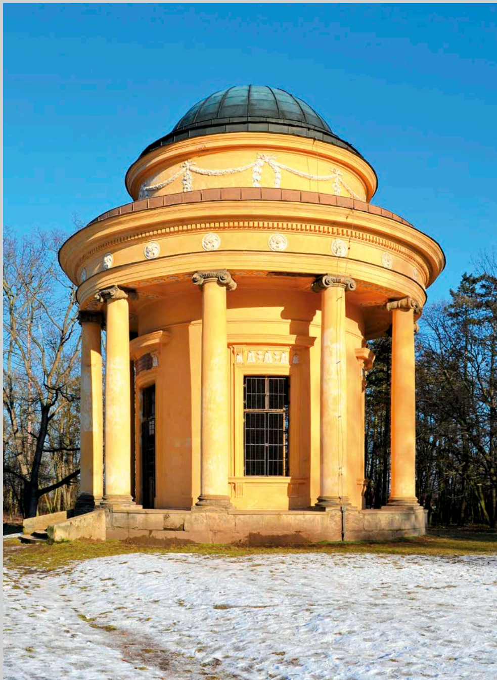
Obr 6: Chrám obránců vlasti a přátel zahrad a venkova ve Veltrusích, na jehož výzdobě se podílel i Petr Prachner.