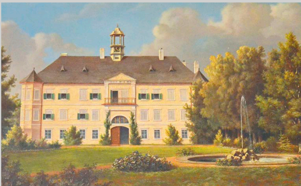
Obr 4: Zámek v Dolní Rožince, jehož okolí Jan Nepomuk Mittrowsky upravil. Ze sbírek Národního památkového ústavu, územní památkové správy v Kroměříži.

a mineralogy amatéry. Třebaže se o zahradní umění zajímal i Czernin, proslul hrabě především jako znalec a mecenáš umění. 26 Urozených přírodovědců, jejichž životy jsou spjaty s krajinotvorbou posledních desetiletí 18. století a kteří se významně zajímali o přírodní vědy nejen ve své vlasti, ale i na cestách, existuje značné množství. Jako příklad může být vybrán hrabě Jan Nepomuk Mittrowsky, jedna z nejvýraznějších postav moravského osvícenství a významný filantrop. Jeho jméno je kromě řady jiných aktivit spjato s vytvořením sentimentálního Pohádkového lesa na panství Dolní Rožinka na Moravě, který je možné označit za zajímavou ukázkou krajinářské tvorby doby osvícenství s řadou altánků, obeliskem a dalšími stavbami.