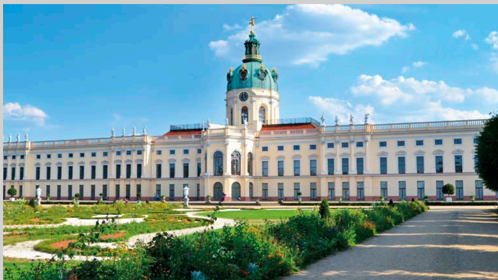
Obr 5: Zámek Charlottenburg v Berlíně.

v cizině soustředil i na přírodní vědy, mohou být jeho řádky ve formě deníkových zápisů, které byly určeny hraběti Belcredimu. 28 Například ve Frankfurtu nad Odrou v přítomnosti profesora medicíny Hartmanna obdivoval Mittrowsky jeho sbírku knih, a především pak herbář, který je „nach den 24. Abtheilungen des Ritter[s] Lineé [sic!] in 24ig Schubladen abgetheilet“. 29 Během svého pobytu v Berlíně vyhledal i jistého zahradníka Krause, který měl „eine erstaunend grosse Menge von ausländischen Pflanzen und Gewächsen, die er Theils offen im Garten, Theils in Treibhäusern hält“. 30 Osvícený hrabě si zároveň vytvořil seznam rostlin, které ho upoutaly. Na programu pak nesměly chybět ani zahrady a parky, jež ukazovaly nadšení Mittrowského pro krajinářskou tvorbu. Příkladem může být jeho návštěva Charlottenburgu v dnešním Berlíně. Aristokrat poznamenal, že „[d]er schöne Garten“ sice „nach altem holländischen Geschmack angelegt ist, aber dennoch eine herrliche Orangerie enthält. Der herrlichste Theil des Garten ist die an der Spree angebrachte herrliche Alee“. 31