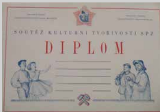
Obr. 4: Diplom udělovaný v soutěži kulturní tvořivosti

Soutěžilo se ve dvou základních kategoriích – jednotlivci a soubory. V kategorii jednotlivců vystupovali žáci v sólovém zpěvu, recitaci, hře na hudební nástroj, uměleckém předčítání, výtvarném umění, literární tvorbě, hudební skladbě, sólovém tanci, lidovém vyprávění, dramatickém projevu, imitování a hře s maňásky. 63 V soutěži vystupovaly soubory pěvecké, hudební, dramatické, recitační a taneční. Soubory později doplnily i dva kroužky – výtvarný a fotografický. 64 Žáci vystupovali v souborech rozdělených podle učebně výchovných skupin. Každý soubor byl povinen předvést ucelený program v délce 15 minut. Výběr všech písní a představení byl ponechán souborům. Den písní byl rozšířen o soutěž jednotlivců, kteří předvedli program v délce 5–10 minut. 65 Také v této soutěži obdrželi vítězové věcné ceny, peněžní ceny a diplomy.