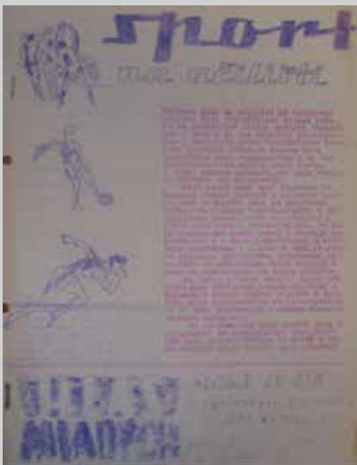
Obr. 5: Titulní strana měsíčníku Hlas mladých (ročník 1., číslo 3.), který vydával OEZ Letohrad