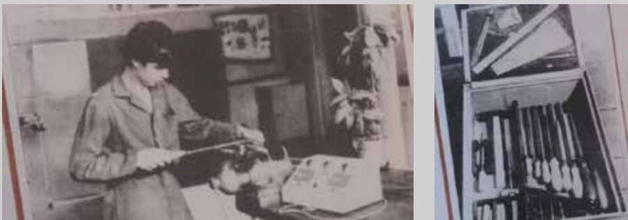
Obr. 1: Učeň při nácviu pilování rovinných ploch na učební pomůcce "trenažér" (vedle svěráku)