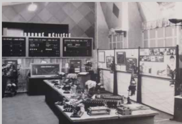
Obr. 3: Výstava učňovských prací v Letohradě v závodním klubu „Kreml“